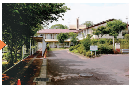
現在のホスピス病棟 (外観)