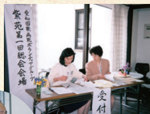
ボランティアグループ 紫苑第一回総会