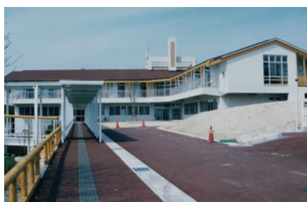
20年前のホスピス病棟 (外観)