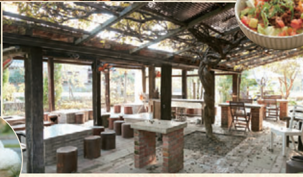
カーテンで覆い、ストーブを焚いて楽しむ冬のバーベキューもおすすめ。