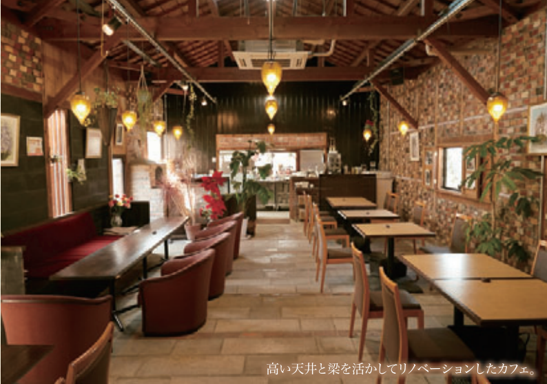
高い天井と梁を活かしてリノベーションしたカフェ。