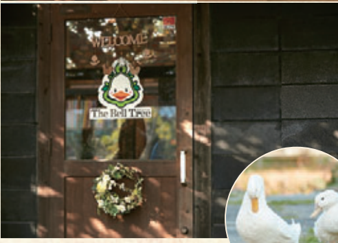
よく遊びにやってくる(?)近所のアヒルたち。店のロゴマークにも。