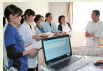
多職種からなる栄養サポートチームが昼食中に病室を訪問。お食事の様子や栄養状態などについて確認して今後の治療計画などに活かしています。

「養の方などのケアにも力を注いでいます。栄養指導の結果、喫食率があがりたり症状が改善することやQOLの向上につながるようがんばっています!」 3人の管理栄養士が情報を共有しているので、たとえば病棟からホスピスへ、愛泉館から病棟へ移られても、患者さんの栄養面や生活面などきめ細かくフォローできて、患者さんにもご家族にも安心していただけるように努めています。