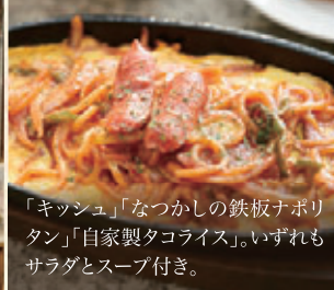
「キッシュ」「なつかしの鉄板ナポリタン」「自家製タコライス」。いずれもサラダとスープ付き。