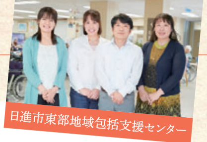
日進市東部地域包括支援センター