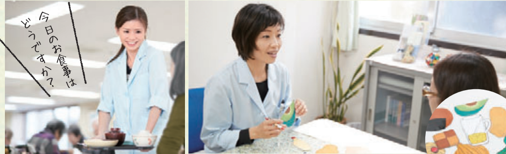
愛泉館では、食事時にテーブルを回りながらゲストのみなさんの食事の様子を確認します。