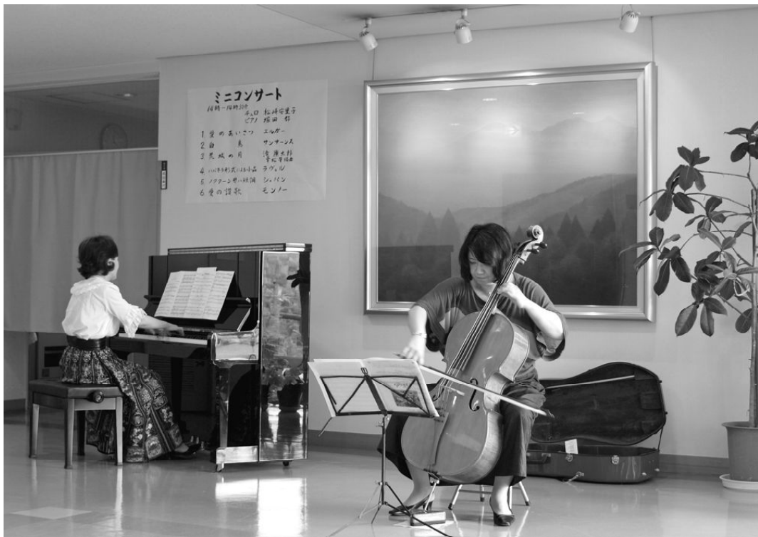
ミニコンサートのリハーサル風景2010. 6. 25